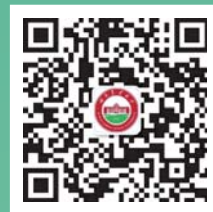
湖南农业大学 成教网络教学公众号