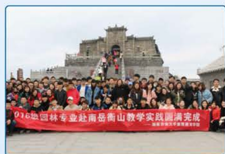
湖南省南岳树木园