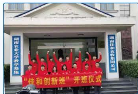
佳和农牧股份有限公司