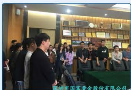
深圳市国富黄金股份有限公司