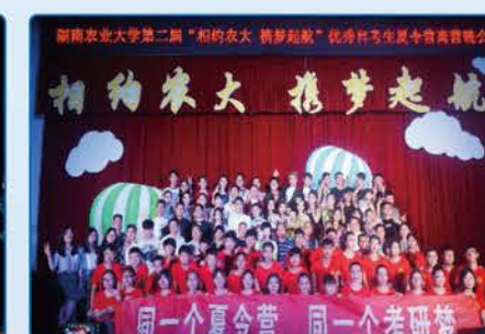
湖南农业大学第二届“相约农大 筑梦起航”优秀学生干部夏令营闭幕晚会 相约农大 筑梦起航 同一个夏令营 同一个考研梦