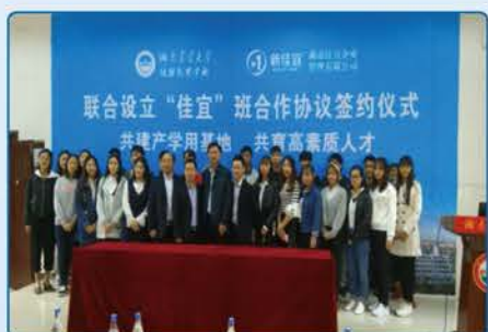
湖南佳宜企业管理有限公司