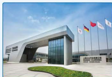
上海大众汽车有限公司