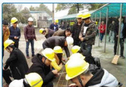
长沙市联城建筑有限公司