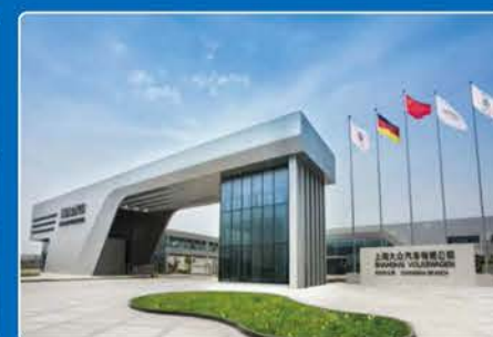
上海大众汽车有限公司