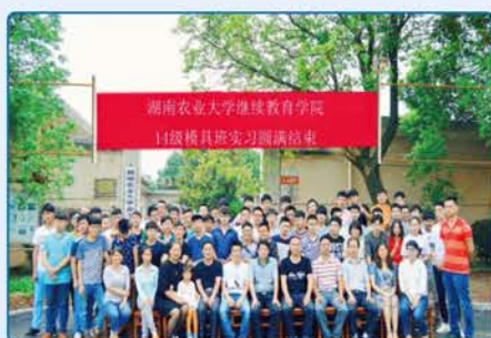
湖南农业大学金工实习厂