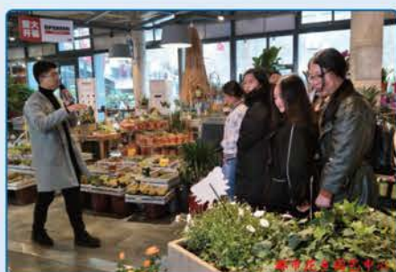
都市花乡园艺中心