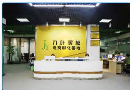
深圳市九叶灵枝电子商务有限公司