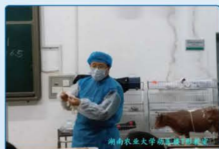
湖南农业大学动物医院