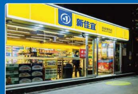
湖南佳宜企业管理有限公司