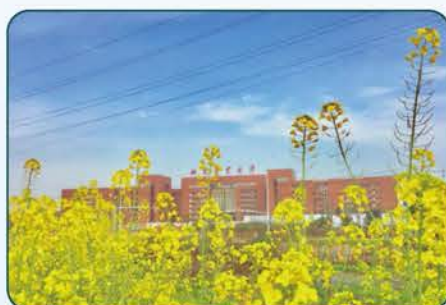
湖南农业大学耘园基地