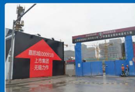
嘉凯城集团股份有限公司