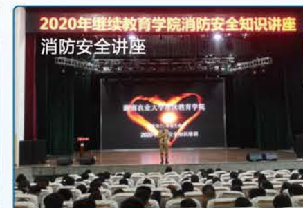
2020年继续教育学院消防安全知识讲座 消防安全讲座