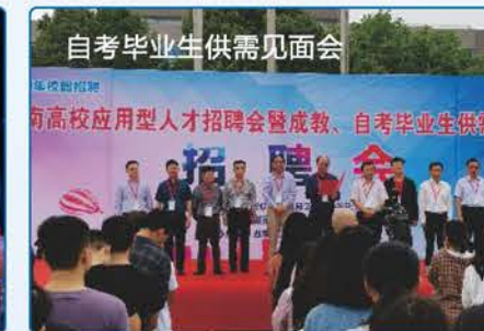
自考毕业生供需见面会