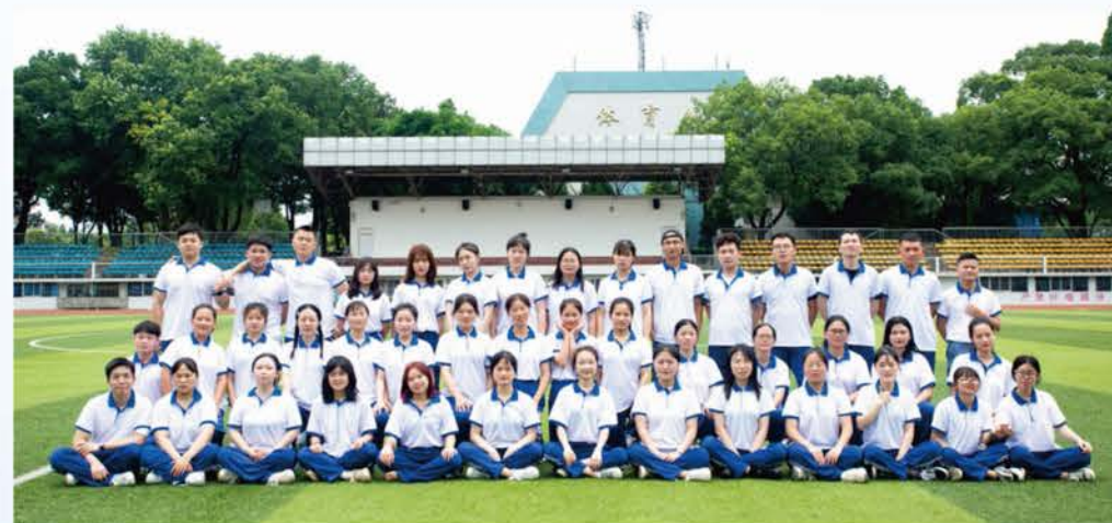
2020年研究生入学考试部分上线学生合影